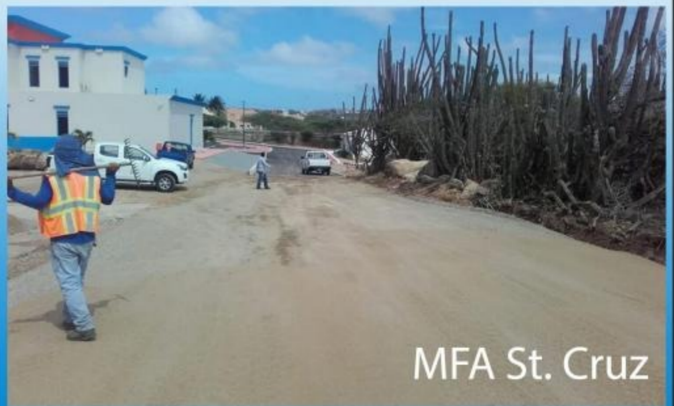
MFA St. Cruz